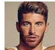
31 ▶ Sergio Ramos futbolista.