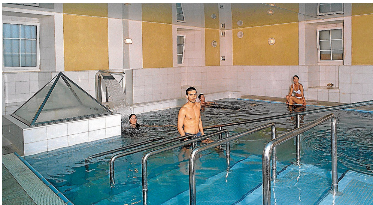
Vista de una piscinas del balneario termal de Lugo, donde harán prácticas de balneoterapia los médicos.

Un 70% de los pacientes con reuma mejora con tratamiento de balneoterapia // Reduce los dolores y ayuda a la movilidad