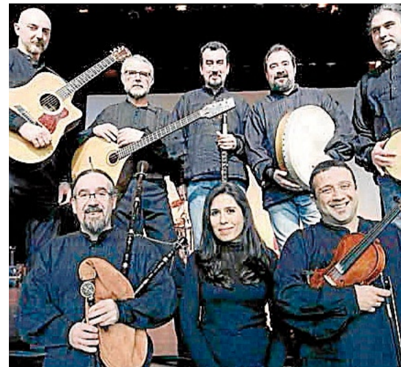
Imaxe da banda coruñesa Luar na Lubre