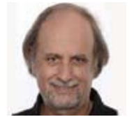
75 ▶ Alfonso Ungria cineasta.