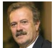
66 ▶ Manuel Campo Vidal periodista.