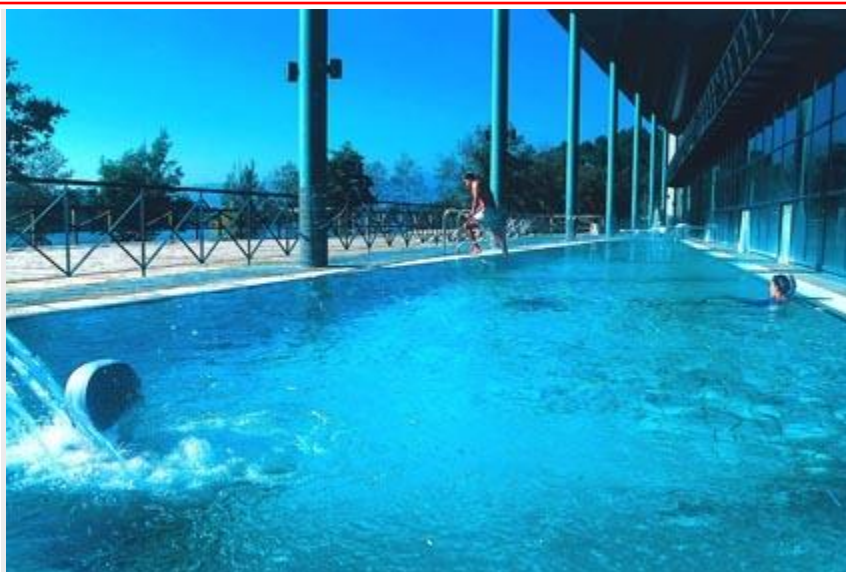
Balneario de Laias, un dos oito da Asociación de Balnearios de Galicia que conta coa “Q” de Calidade Turística