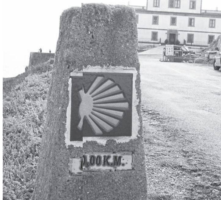
Señalización de la ruta jacobea junto al faro de Fisterra