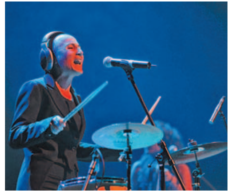
Peón inicia hoy el ciclo de conciertos del Apóstolo. X. A. SOLER

El grupo de pandereteiras Raigañas de Cerqueda formará parte de ese cruce de