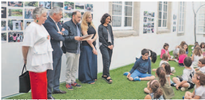
La exhibición reúne los trabajos plásticos realizados durante las actividades. C. VILLAVERDE