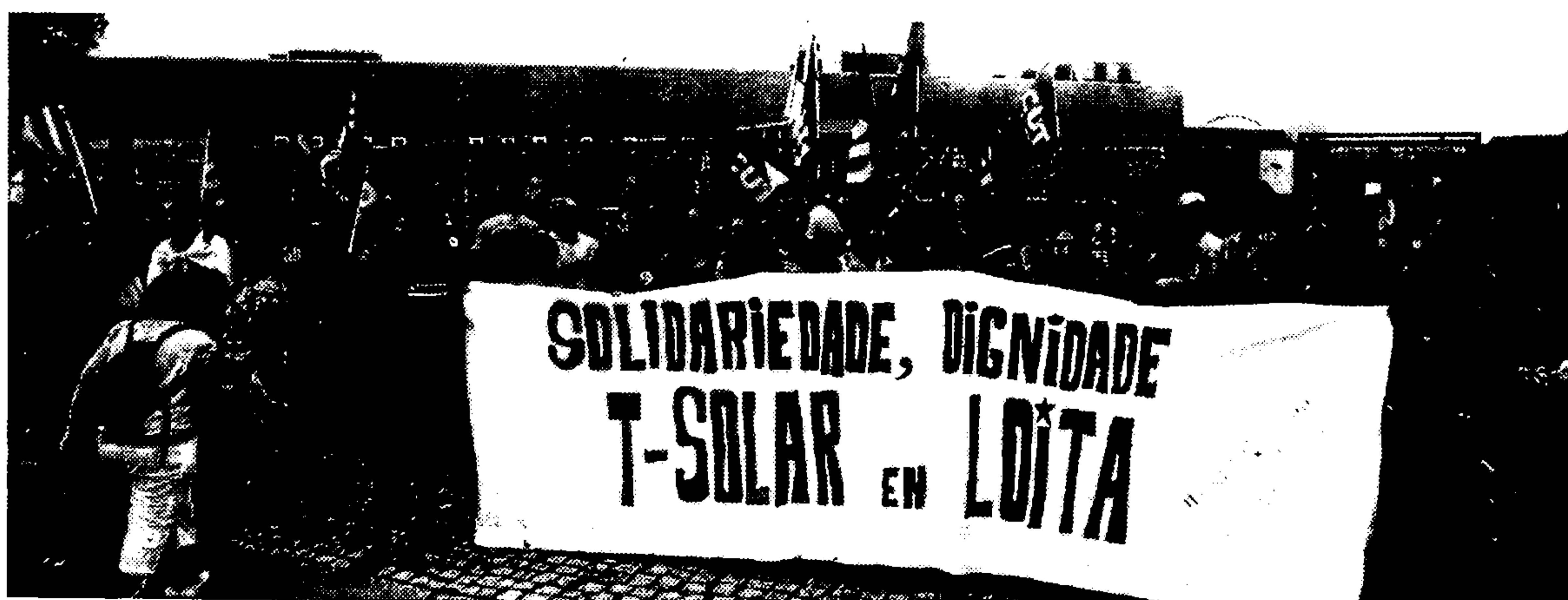
Concentración en defensa del mantenimiento de la actividad y los puestos de trabajo en T-Solar.

de compra de la planta, que permitan mantener la actividad en la planta. Asimismo, los empleados reclaman a la Xunta que participe en la negociación, con el fin de garantizar que se prioricen las ofertas que garanticen el mantenimiento de la actividad y de los puestos de trabajo. ■