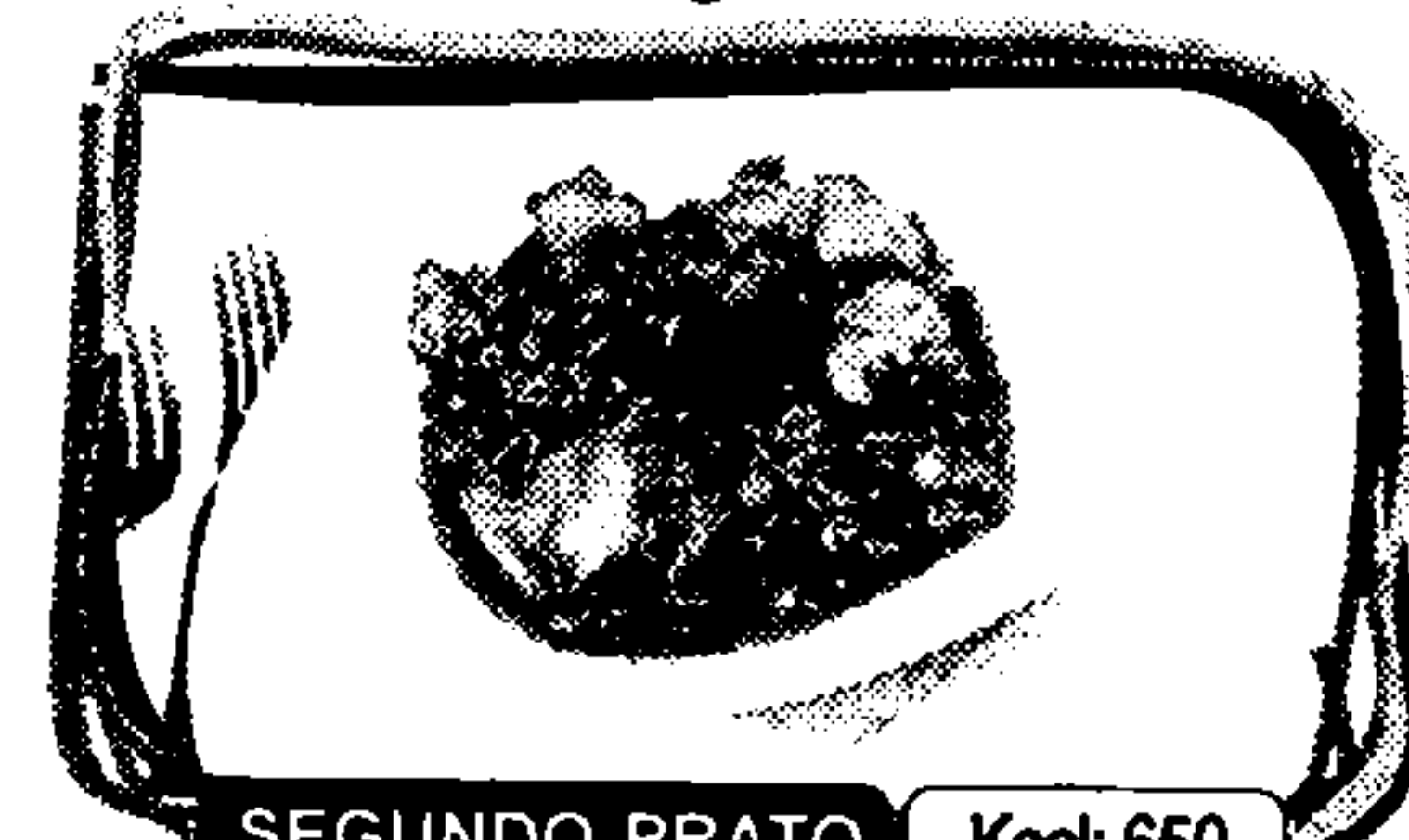
SEGUNDO PRATO Kcal: 650

A pasta é un grande aporte en hidratos de carbono de absorción lenta (amidón) e proteínas (glute), e ten un baixo contido en graxas.