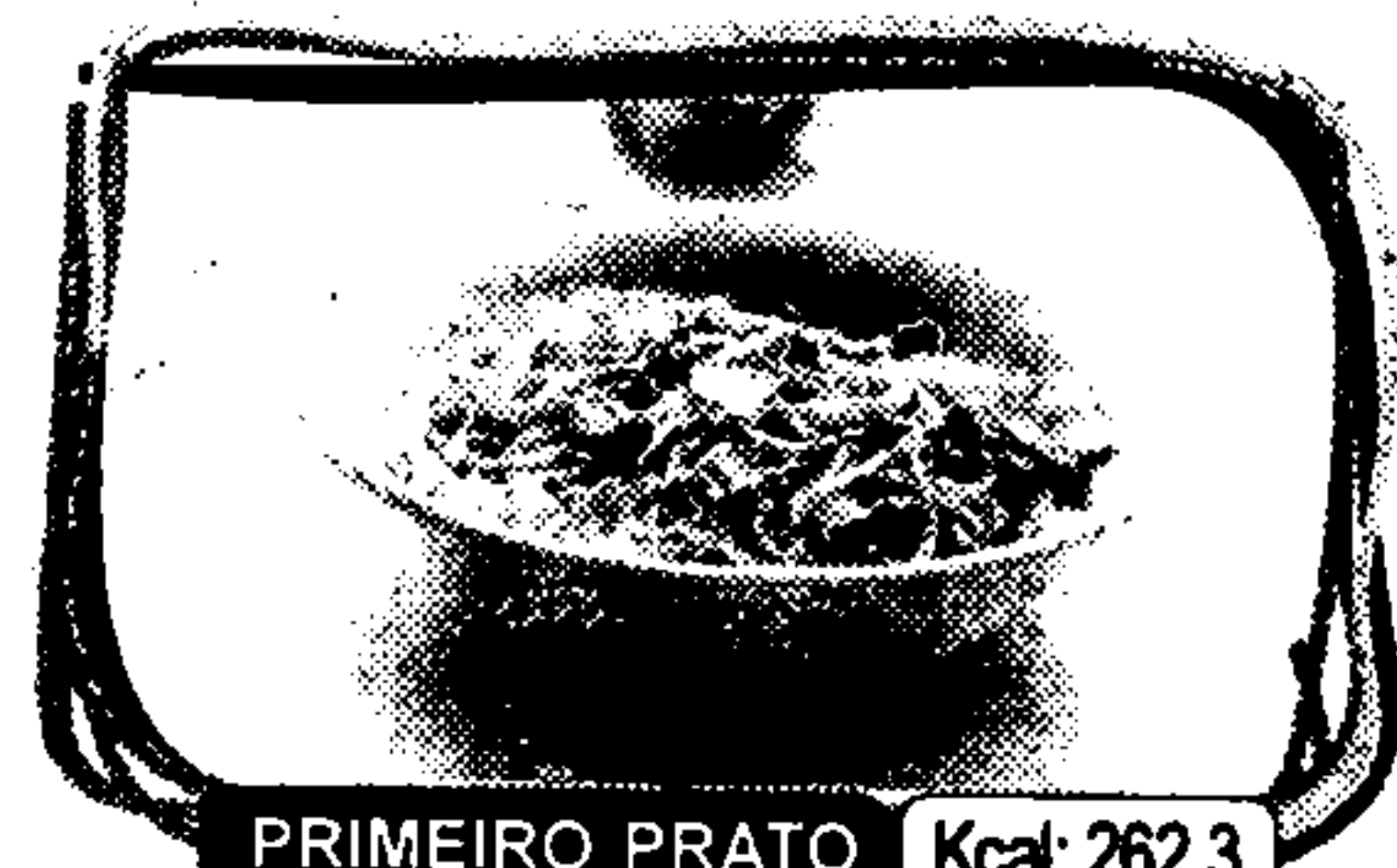
PRIMEIRO PRATO Kcal: 262,3

Un menú preparado cada día y en exclusiva por expertos nutricionistas e cocinheiros galegos, para levar ou coller a receita e facelo na casa