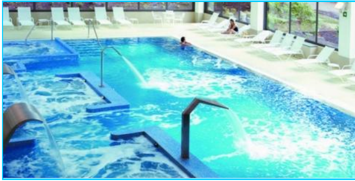
Las reservas de los balnearios gallegos están casi al completo