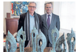
El consejero y el escultor, en la presentación de las piezas

La entidad Asoar y la cofradía de pescadores de Muxía colaboran con el Concello en la organización de unos actos preparados con motivo del décimo aniversario del Prestige.